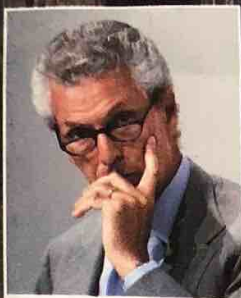
Marco Tronchetti Provera

COSÌ È SALTATO IN 10 GIORNI IL PROGETTO BAROLO